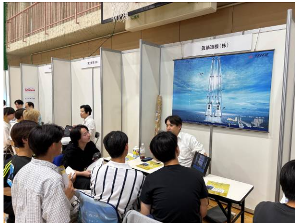
各社ブースで熱心に説明を聴いている様子