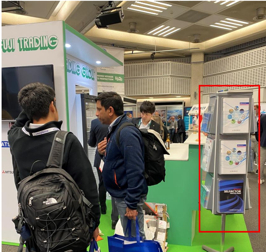
ロゴ掲載イメージ