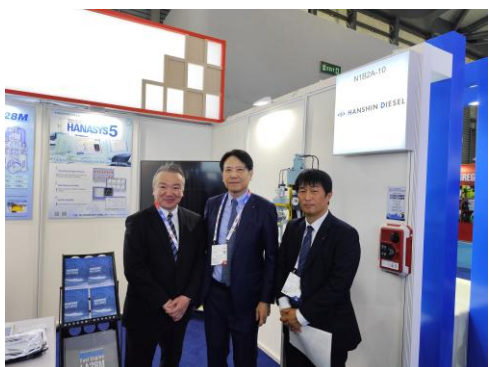
岡田総領事・大使訪問の様子