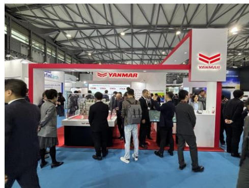
日本パビリオンの様子