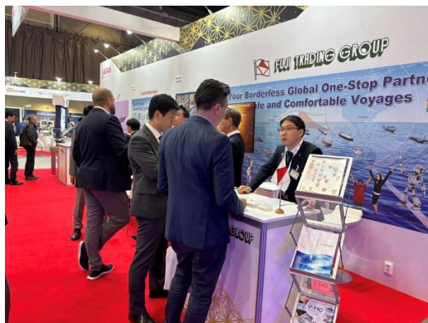
日本パビリオンの様子