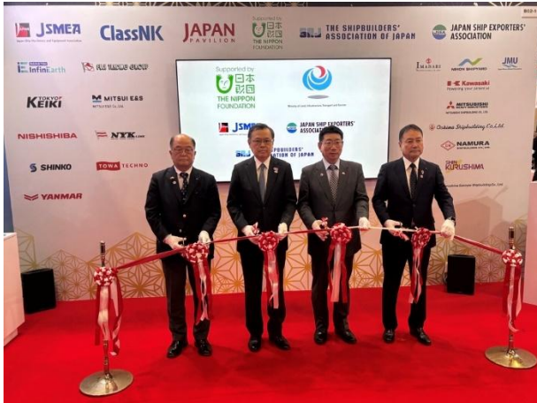
日本パビリオン テープカットの様子