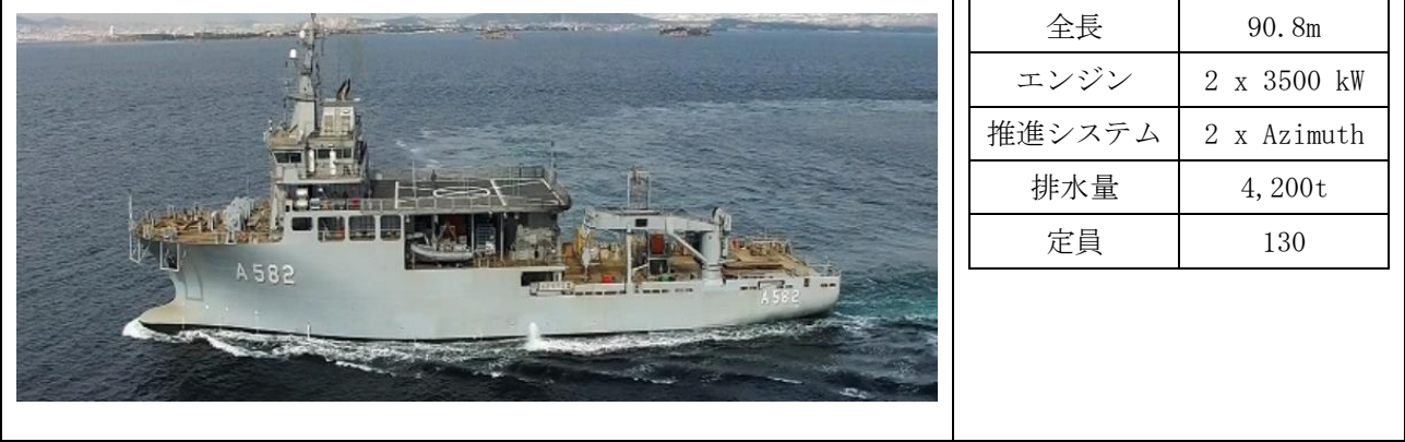
図 1 潜水艦救助母船の概要