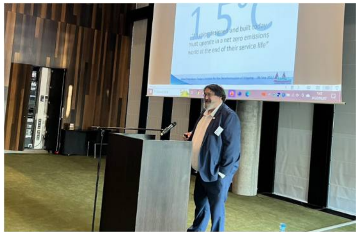
㈱商船三井 山口執行役員による講演