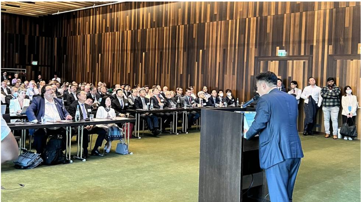
定員をオーバーし立ち見客で溢れた。