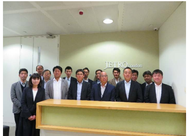
Japan Ship Centre (JETRO) での記念撮影