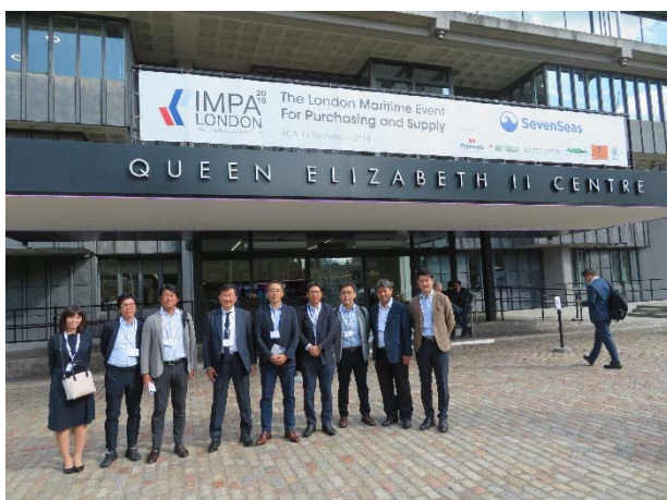
IMPA London2019 展示会会場入口前での記念撮影