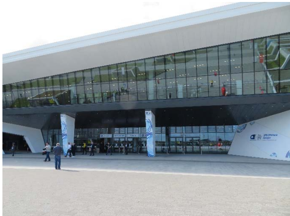
Offshore Europe 会場入り口