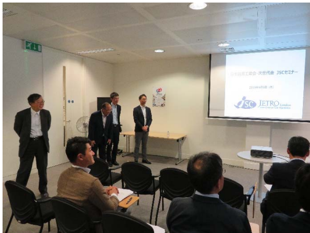
Japan Ship Centre (JETRO) ロンドン講演会