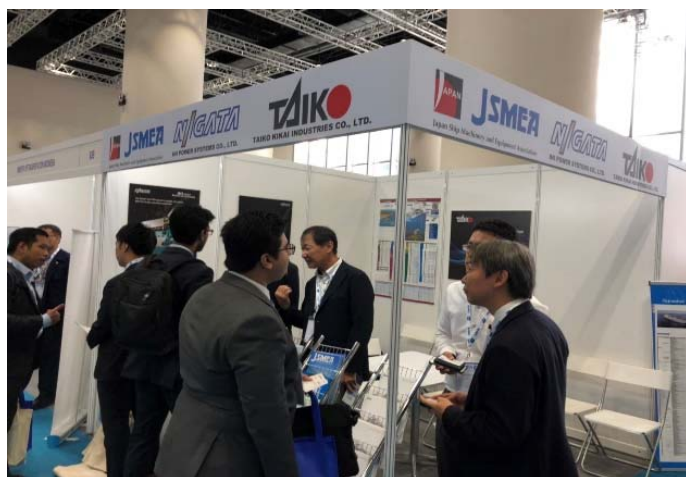
当会ブースの様子