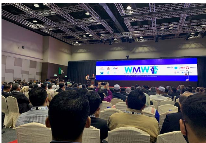
WMW' 19 展示会 オープニングセレモニーの様子