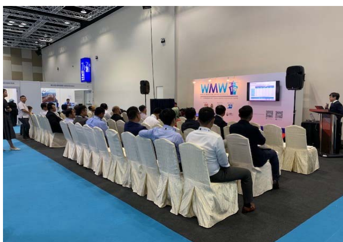
(株)IHI 原動機によるプレゼンテーションの様子