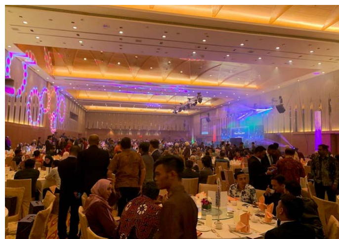
MASA 主催のディナーパーティーの様子