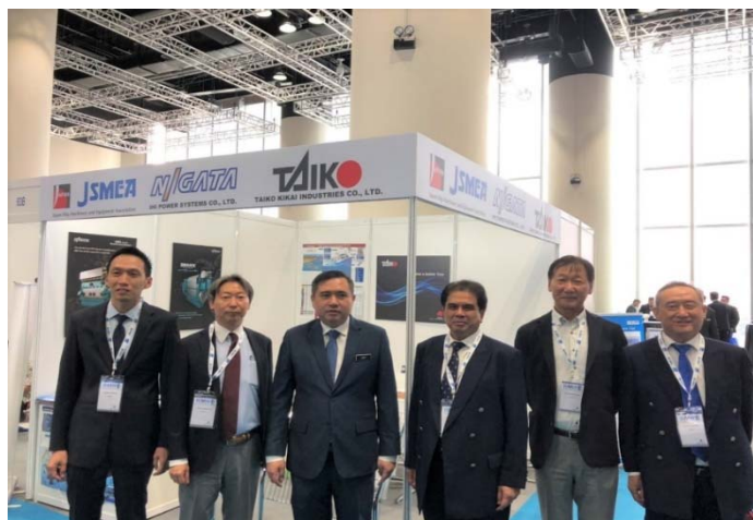
当会ブースの様子