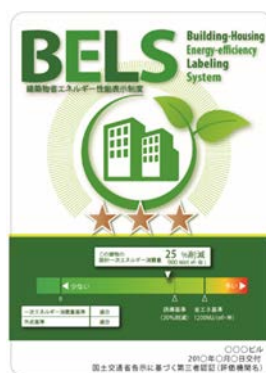
[図1] ガイドラインに基づく第三者認証の例

また、ダイヤモンドリスponsに対応した時間帯別・季節別の電気料金メニューが選択できる場合はその活用に努めるとともに、エネルギー管理システム（BEMS・HEMS等）の導入により、ビルの運用方法、住宅の住まい方の改善によるピーク対策及び省エネルギーに努めること。