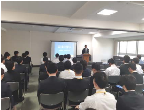
眞鍋社長による基調講演の様子