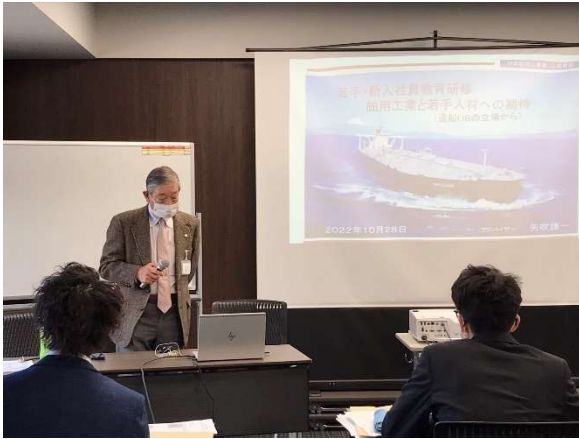
矢吹アドバイザーによる講演の様子