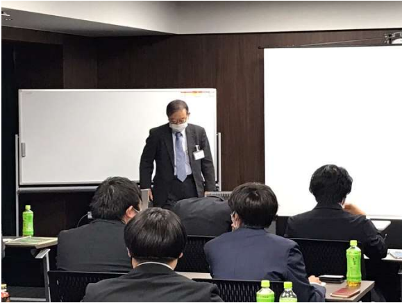
安藤専務理事による講演の様子