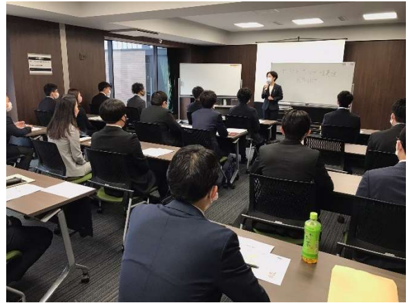
ビジネスマナー講座の様子