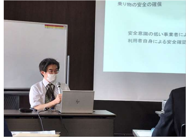
中橋業務部長による講演の様子