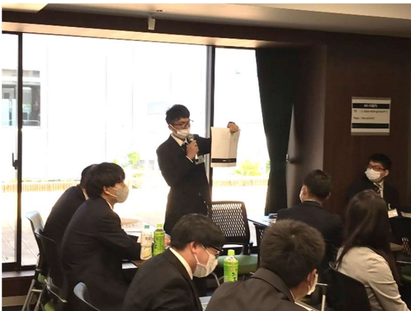
アイスブレイクの様子