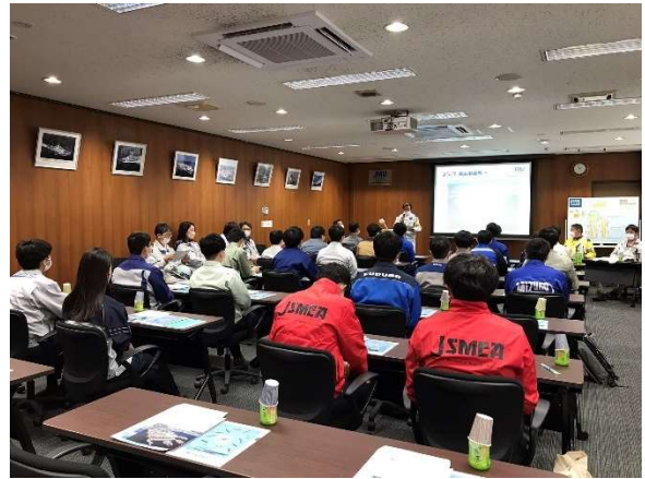
造船所見学の様子