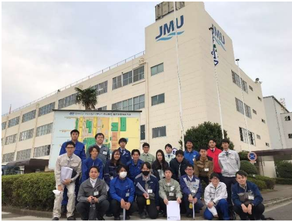
造船所見学の集合写真